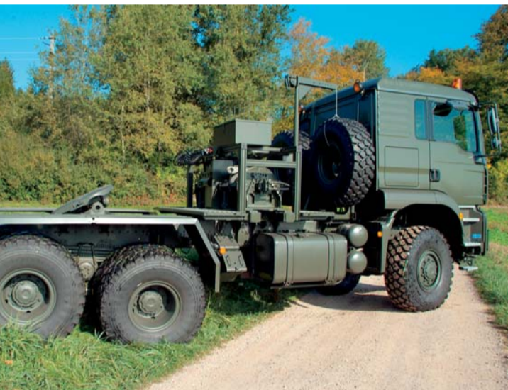
Ein Ersatzradhalter für zwei Ersatzräder befindet sich zwischen Fahrerhaus und Doppelwindenaggregat.

Weitere Infos zu Seilwindenanlagen für Panzertransporter anfordern unter marketing@rotzler.de