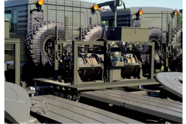
Schwerlasttransporter mit Rotzler HZ 200-Doppelwindenanlage (Zugkraft: 2 x 200 kN)

Weitere Infos zu Seilwindenanlagen für Panzertransporter anfordern unter marketing@rotzler.de